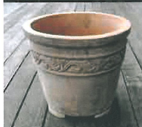
Brug krukkefodder under dine krukker.