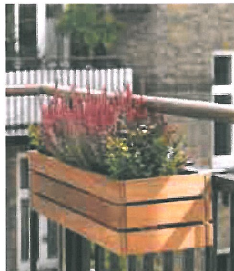
Altankasser skal hænge på frontholderlisten.